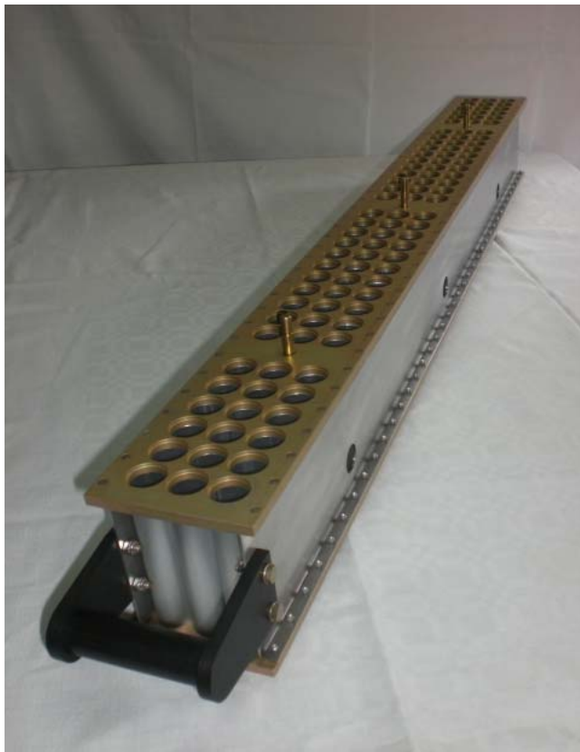
Rack porta cartuchos lucha antigranizo

Cugino Ingeniería en conjunto con la Dirección de Agricultura y Contingencias Climáticas del Gobierno de la Provincia de Mendoza además de haber desarrollado el diseño y fabricación de Kits para la lucha antigranizo llevada a cabo por dicha Dirección a provisto partes de repuesto para Kits e otro origen que también son operados mejorando sustancialmente el diseño y calidad de los componentes y adicionando elementos que permiten una mejor y eficiente operación de los mismos.